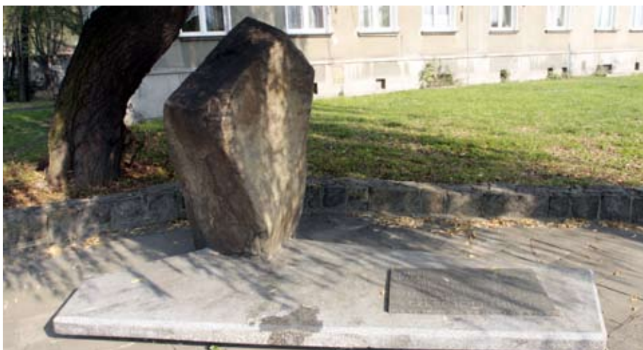
Głaz z tablicą przy ul. Kościuszki upamiętnia publiczną egzekucję członków ruchu oporu w czasie hitlerowskiej okupacji.

Tablica poświęcona ofiarom mordów dokonywanych na ludności cywilnej w okresie II wojny światowej oraz powojennych walk niepodległościowych. Upamiętniająca zbrodnie komunistyczne na ludności cywilnej oraz ofiary mordów na terenach dzisiejszego woj. podkarpackiego, dokonywanych przez oddziały nacjonalistycznej UPA (ukraińskiej armii powstańczej).