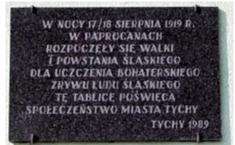
Tablica pamiątkowa na budynku Przedszkola nr 3.

Po wprowadzeniu stanu wojennego 13 grudnia 1981 r. w całej Polsce w zakładach przemysłowych rozpoczęła się fala strajków. Protesty w śląskich kopalniach były nie tylko najtragiczniejsze (pacyfikacja kopalni „Wujek”), ale także najdłuższe. Tablica upamiętnia uczestników