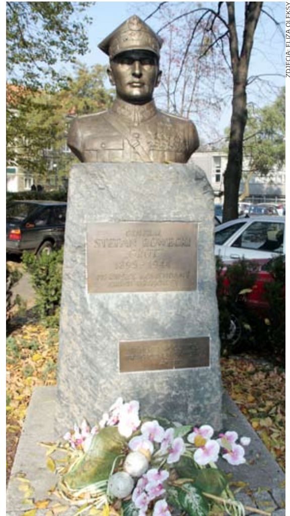
Popiersie gen. Stefana Grota-Roweckiego.