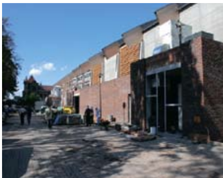
Hala Lodowa w Cieszynie.