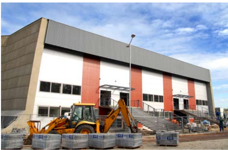
Prace na tyeskim lodowisku postępują zgodnie z planem.

Budżet organizacyjny festiwalu to około 7 mln zł. Na tę kwotę składa się 880 tys. euro dotacji unijnej, 2,5 mln zł pochodzących z wplat Narodowych Komitetów Olimpijskich – reszta to pieniądze z budżetów samorządów miast-gospodarzy, samorządu województwa, Polskiego Komitetu Olimpijskiego i środki sponsorskie.