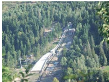
Skocznia Skalite w Szczyrku.