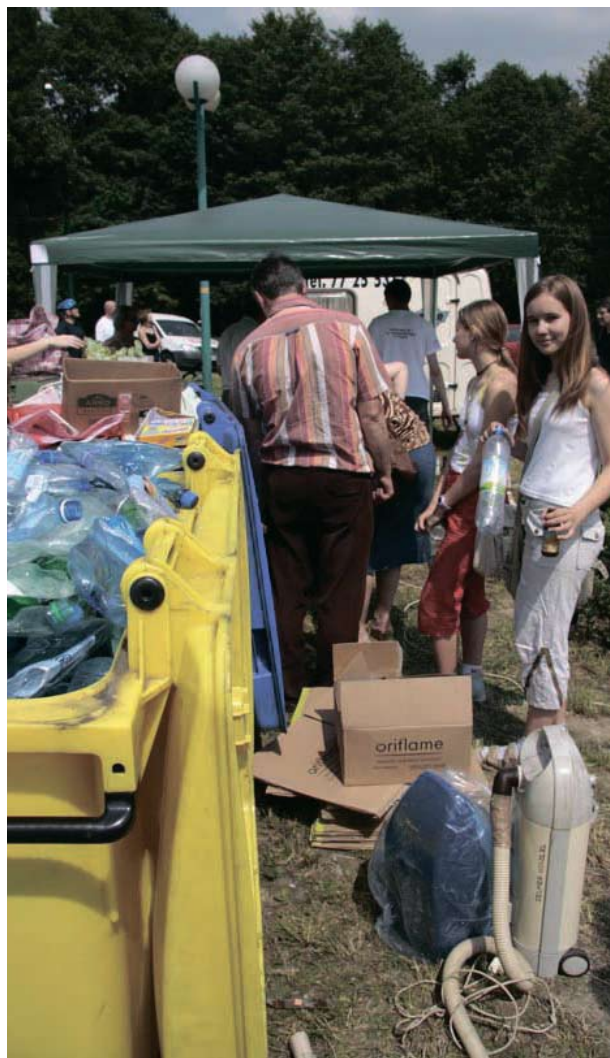
Segregację odpadów promowano także podczas niedawnego festiwalu ekologicznego Eko-Master.

Makulatura, zamiast w szkołach, zbierana jest teraz w specjalnych pojemnikach do segregacji odpadów. Ładują tam też aluminiowe puszki, szklane butelki oraz plastikowe opakowania. Zamiast na zbiórki, szkoły postawiły na edukację ekologiczną. Efekty już widać. W ostatnich ośmiu latach ilość segregowanych odpadów wzrosła aż 30-krotnie. Siedem lat temu program selektywnej