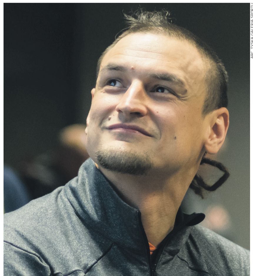
ARC-TYSKA GALERIA SPORTU