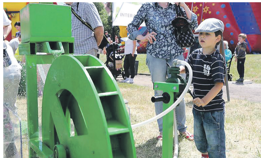
MAT PRASOWE UM TYCHY

Będzie też koncert grupy „Recycling band”, spektakl dla dzieci, wystawa