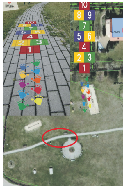
Tak będzie wyglądać miejsce zabaw dzieci na osiedlu Z1.

W Parku Miejskim pojawi się plansza do gry w „klasy” w kształcie rakiety. Podobna zostanie wykonana w Parku Niedźwiadków – tutaj dodatkowo będzie można zagrać w „lustro” (na lustrzanej planszy jeden z uczestników powtarza ruchy drugiego). W Parku Jaworek do dyspozycji dzieci będą plansze do gry w „klasy”, „twistera” i w „tarczę” (rzuty do celu). Z kolei na placu zabaw przy ul. Nowej powstaną klasyczne „klasy” i plansza „tapy King-Konga”.