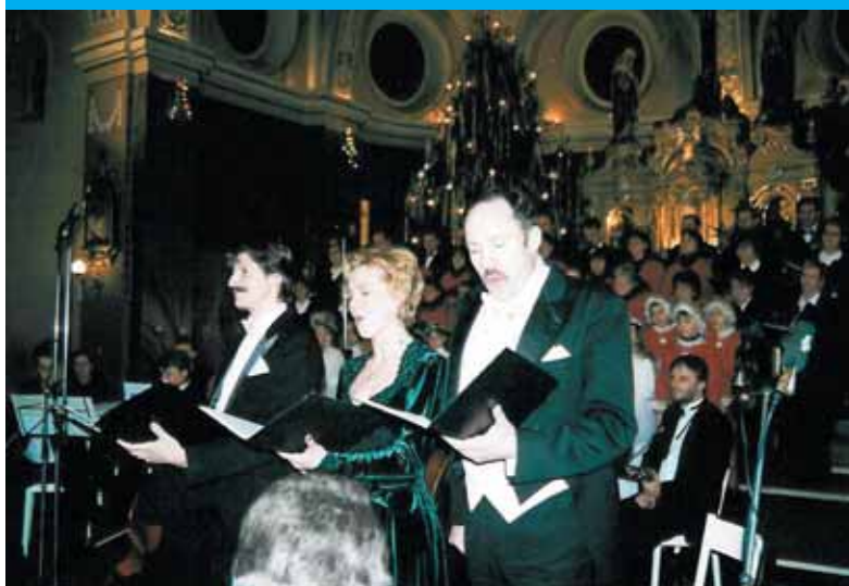
Koncert galowy Tyskich Wieczorów Kolędowych