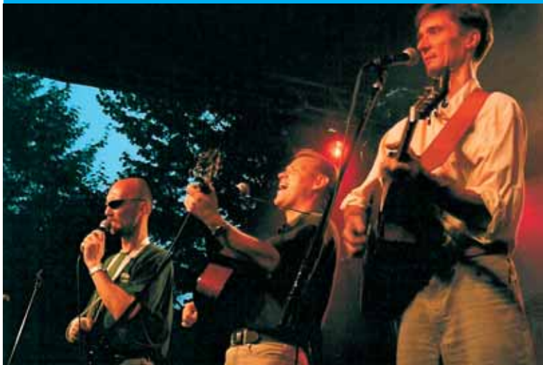
Festiwal szantowy „Port Pieśni Pracy”