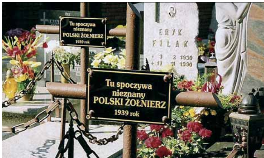
Fragment cmentarza przy ul. Nowokościelnej