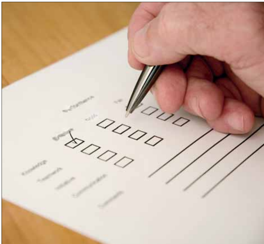
12 listopada wybierzemy naszych przedstawicieli