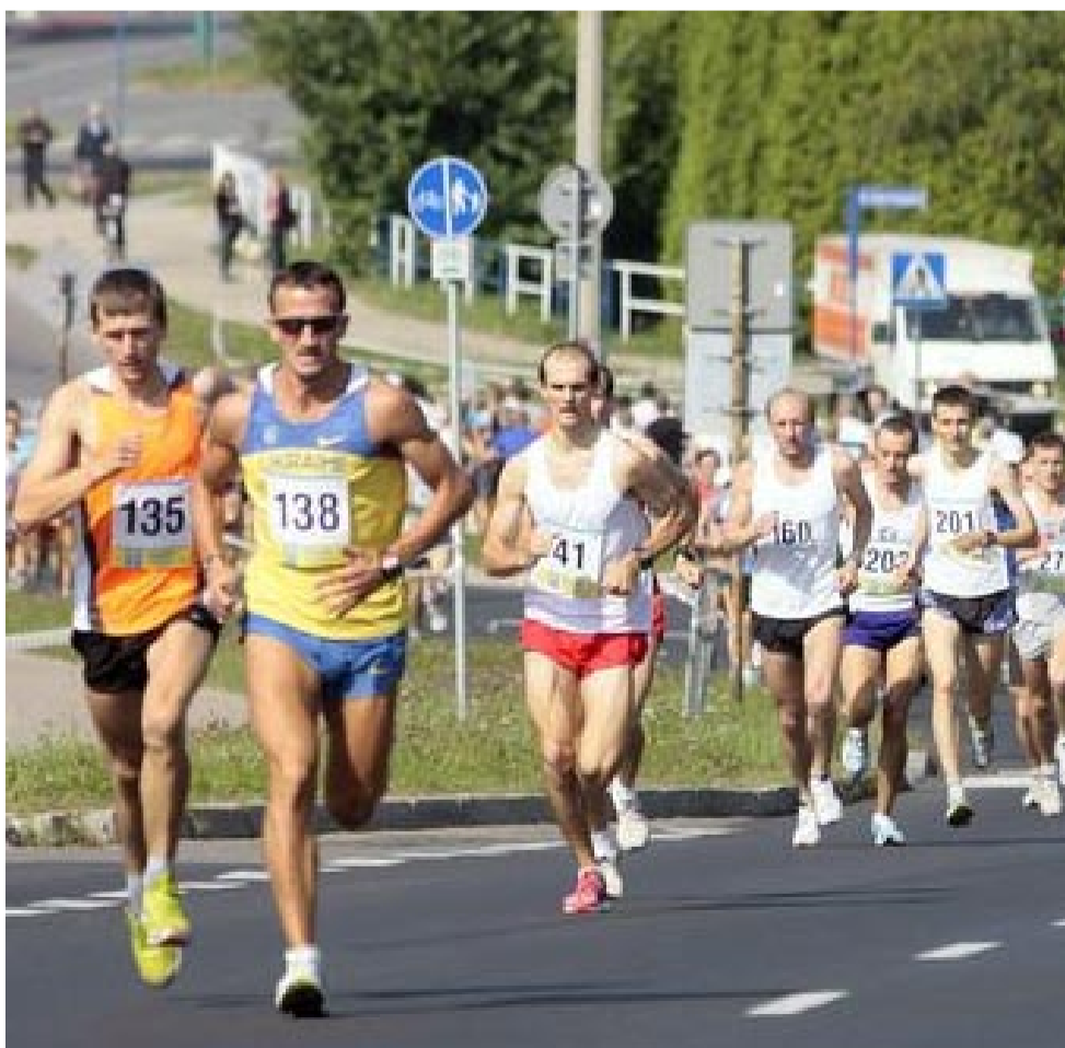
W obu biegach oraz w imprezie dla dzieci co roku startuje ok. 1000 uczestników.