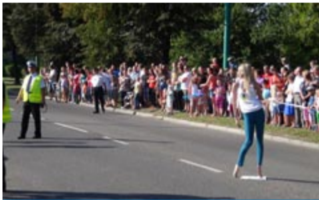
Największą atrakcją imprezy był pokaz potrącenia manekina przez rozpędzony samochód.