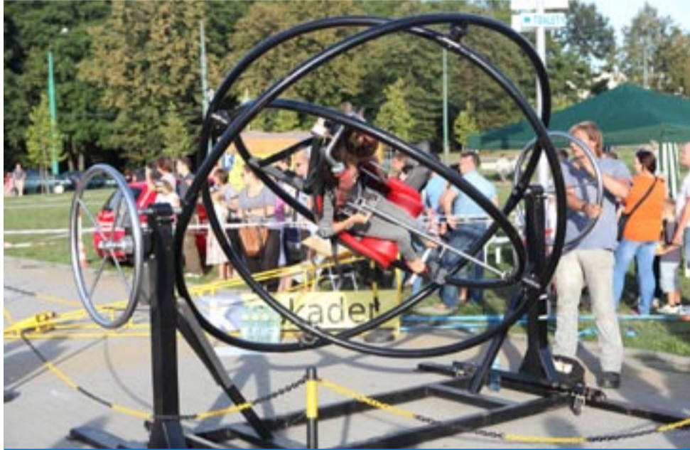
W słoneczne, niedzielne popołudnie tyskanie chętnie korzystała z niespodzianek, jakie czekały na nich w Parku Miejskim.

Impreza była formą pikniku rodzinnego z atrakcjami dla dużych i małych. Mieszkańcy mieli okazję m.in. przyjrzeć się z bliska policyjnym radiowozom i karetkom pogotowia. Mogli skorzystać z trolei czyli samochodów do nauki jazdy w ekstremalnych warunkach, alkoholu, a także wziąć udział w konkursie na najszybszą wymianę opony samochodowej. EWA STRZODA