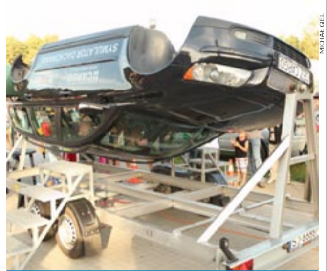
Uczestnicy mogli wypróbować symulatory dachowania i zderzenia.