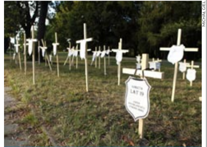
Na ul. Edukacji pojawił się szereg krzyży. Każdy z nich upamiętniał niedawną ofiarę wypadku drogowego.