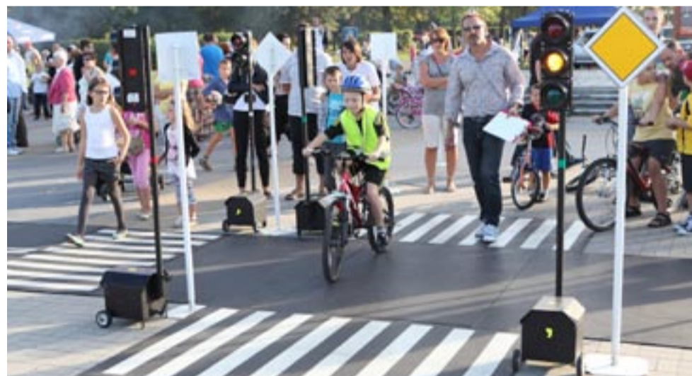
W mobilnym miasteczku, pod okiem instruktorów, każdy maluch uczył się bezpiecznej jazdy. Dzieci mogły poczuć się jak prawdziwi uczestnicy ruchu drogowego.