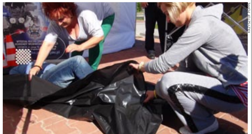
W piątek fundacja „A Widzisz” razem z policją na ul. Sikorskiego przeprowadziła nietypową akcję. Na piratów drogowych, zamiast mandatów, czekał karawan i czarny worek.