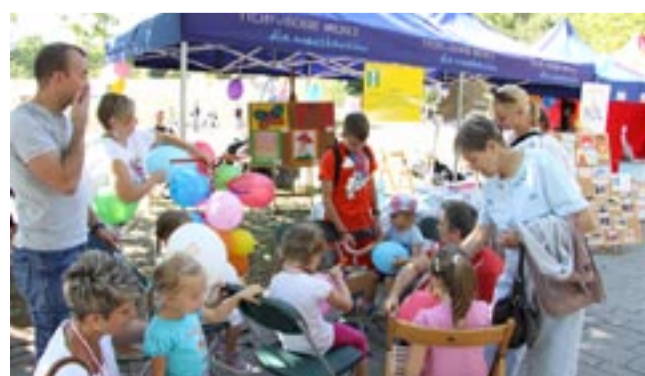
W imprezie wzięło udział także sześć organizacji z Tychów.