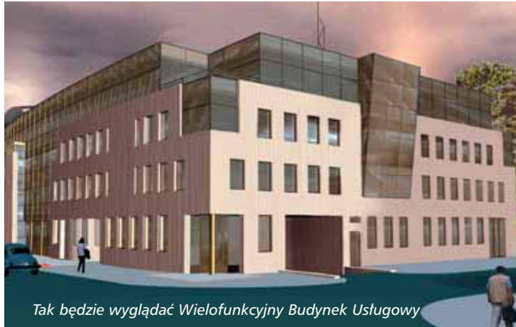
Tak będzie wyglądać Wielofunkcyjny Budynek Usługowy

Powodzenie całego przedsięwzięcia zależy także od dobrej współpracy z Rejonowym Przedsiębiorstwem Wodociągów i Kanalizacji, które zarządza sieciami kanalizacyjnymi