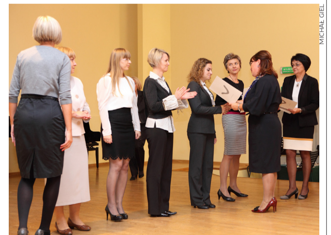
W czasie uroczystości wręczono nagrody Komisji Edukacji Narodowej, Śląskiego Kuratora Oświaty i Prezydenta Miasta Tychy.