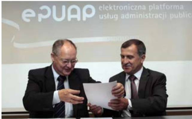
Tychy jako pierwsza gmina w Polsce mogą nadawać profile zaufane. 27 czerwca minister Piotr Kołodziejczyk i prezydent Andrzej Dziuba podpisali ośmioro umowę.

– Cały czas pracujemy nad integracją systemu z wewnętrznym obiegiem dokumentów