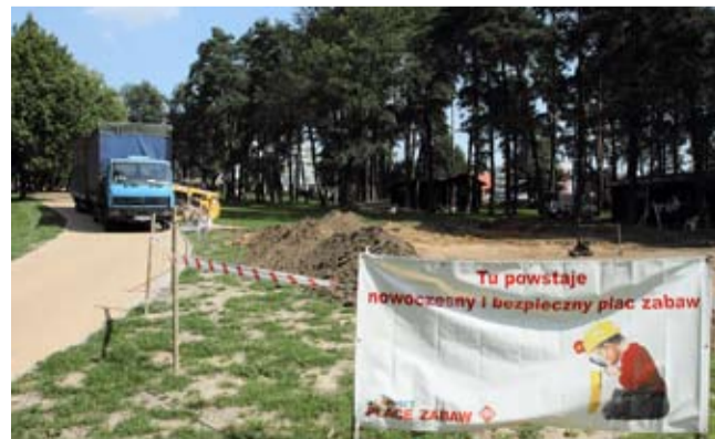
Na terenie OW Paprocany rozpoczął się montaż marynistycznego placu zabaw.