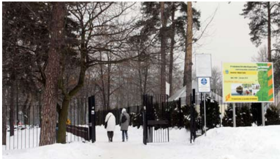
W planach jest m.in. budowa nowego wejścia głównego i promenady spacerowej.

Rok 2010 może przynieść przełomowe rozwiązania w kwestii własności terenów, mających wejść w kompleks Parku Paprocany. Podczas czwartkowej sesji Rady Miasta radni podjęli uchwa-