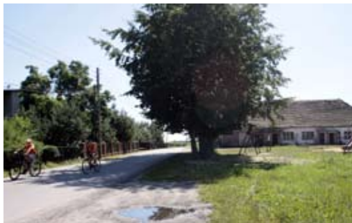
Właśnie w tym miejscu w Urbanowicach rozpoczęły się działania powstańcze.

Bezpośrednią przyczyną wybuchu I Powstania Śląskiego było aresztowanie śląskich przywódców Polskiej Organizacji Wojskowej oraz terror i represje ze strony władz niemieckich (m.in. masakra w Mysłowicach). Powstanie objęło głównie powiaty: pszczyński i rybnicki oraz część okręgu przemysłowego.