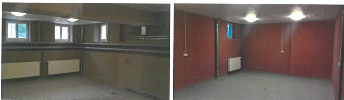
Fot. Stan po remoncie

W wyniku realizacji zadania budynek przy ul. Andersa 6 oraz jego otoczenie nabrało nowego wyglądu, nawiązując do pierwotnej kolorystyki budynku. Zakres wykonanych prac został uzgodniony z Miejskim Konserwatorem Zabytków.