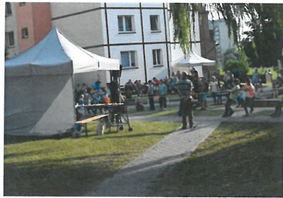
Fot. Spotkanie społeczności lokalnej na osiedlu Ł

W ramach projektu zorganizowano spotkanie podsumowujące, które odbyło się 23 lipca 2018 roku. Szczegółowa analiza dwóch edycji „Dni Sąsiada” pokazała, że działania w społecznościach lokalnych, integrujące te społeczności oraz angażujące mieszkańców wymagają długoterminowego i „lokalnego” podejścia i powinny być realizowane przez podmioty lokalne. Wyłonienie takich podmiotów jest niezbędne, aby takie procesy uruchomić i kontynuować cyklicznie w zmodyfikowanej o dotychczasowe doświadczenia formie.