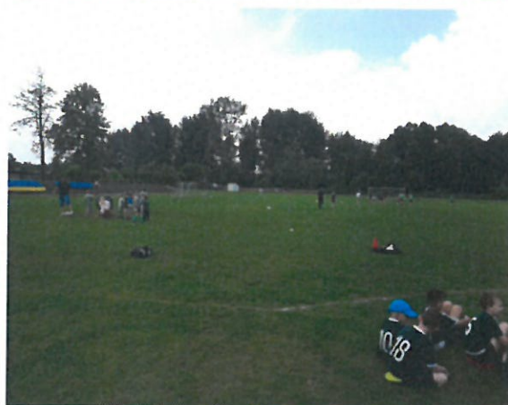
Fot. Zajęcia sportowe na stadionie „Czułowianka”