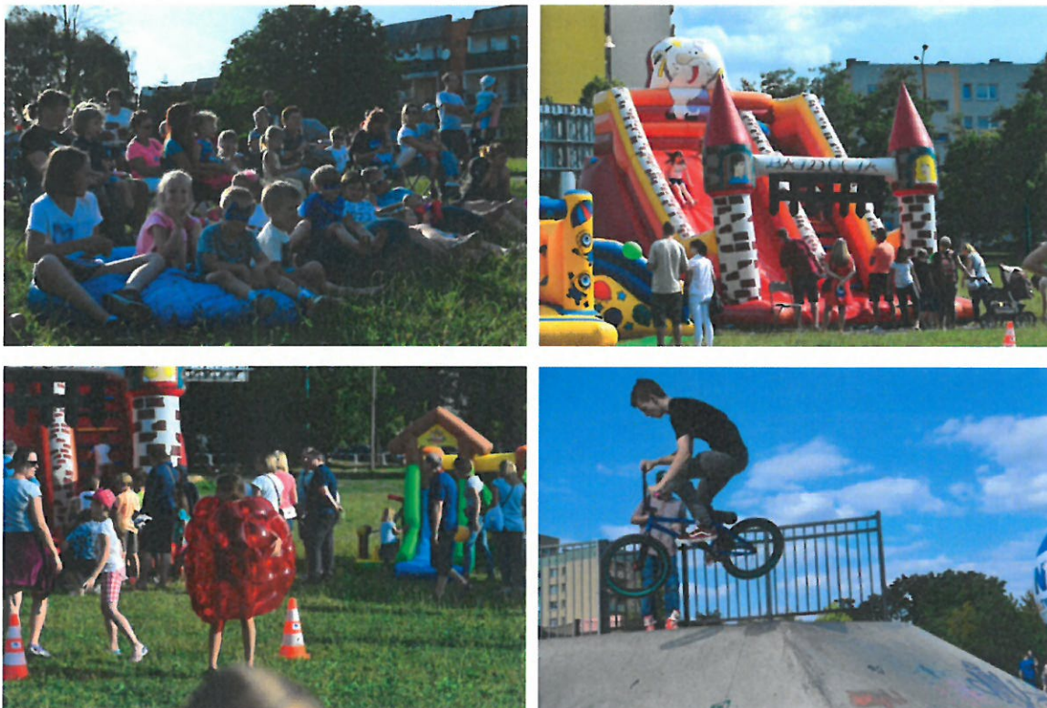
Fot. Plenerowe animacje dla dzieci, pokazy w skate parku, dmuchańce.

części miasta do odwiedzenia osiedla. Lokalna restauracja Rock and Rondel zapewniła poczęstunek dla wszystkich uczestników. Wykorzystując walory parku, uczestnicy w bezpiecznym środowisku aktywnie korzystali z animacji dla dzieci oraz rywalizacji sportowych. Dużym zainteresowaniem w trakcie festynu cieszyły się warsztaty recyklingowe. Punktem kulminacyjnym był spektakl Teatru Lufcik na korbkę pt. „Jak górnik Śmierdzirobótka ze skarbnikiem się spotkał”.