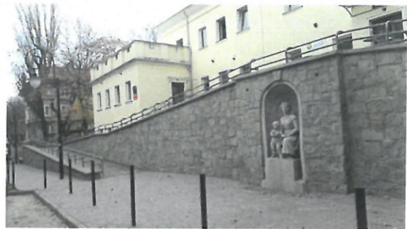
Fot. Stan po remoncie