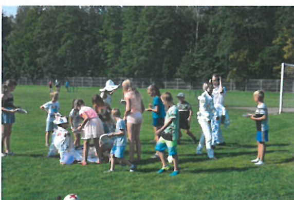
Fot. Strzelanie z łuku, interaktywny teatr, animacje, wspólne zabawy