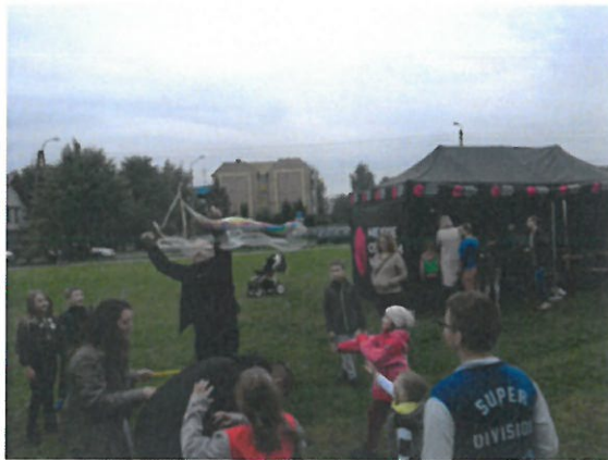
Fot. Animacje, gry i zabawy dla dzieci, bańki mydlane, dmuchańce, poczęstunek