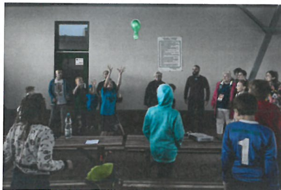
gry i zabawy dla dzieci i dorosłych, zespołowa gra „balonówka”