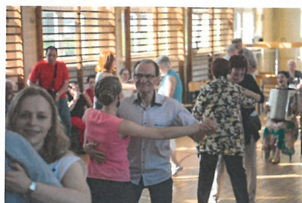
„Zabawa taneczna z folklorem miejskim”