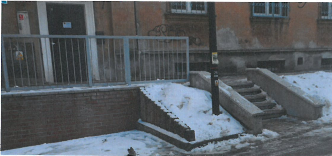
Fot. Stan po remoncie