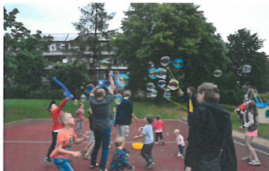
występy najmłodszych, pokazy baniek mydlanych