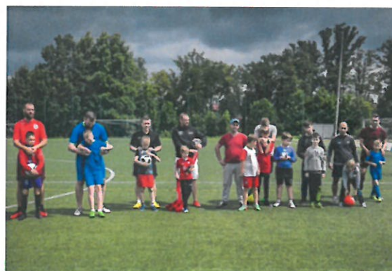
animacje dla dzieci, mecz piłki nożnej „Tatusiowie kontra synowie”