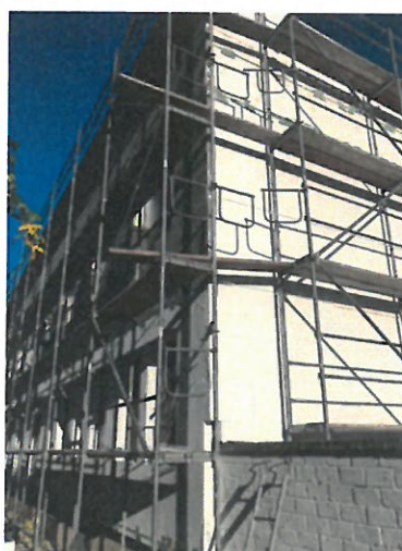
Fot. Postęp prac budowlanych w budynku przy ul. Edukacji 11