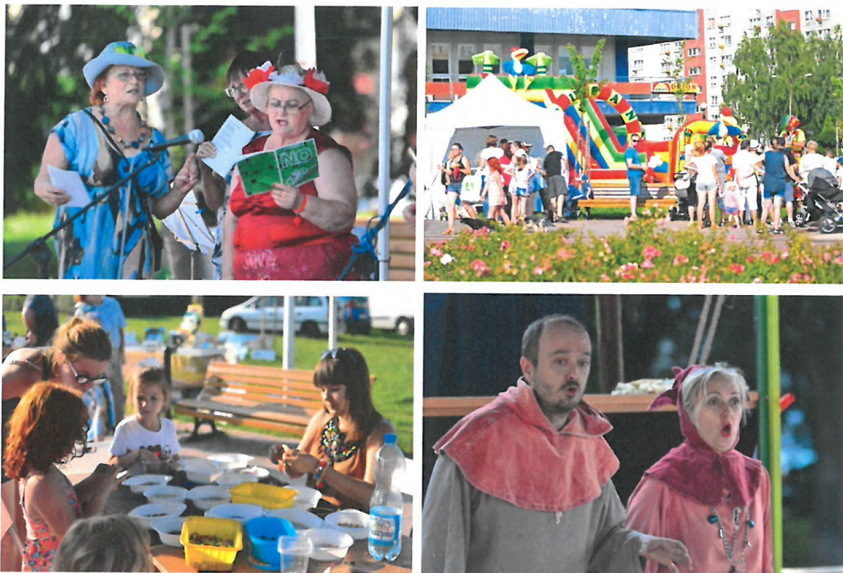
Fot. Warsztaty dla dzieci z recyklingu, tworzenia biżuterii, dmuchańce, spektakl dla dzieci

Wszystkie imprezy w ramach projektu spotkały się z dużym zainteresowaniem. W ramach działań promocyjnych wydarzeń „Kultura Osiedla – Osiedle Kultury” przygotowano plakaty oraz informacje na stronie internetowej Urzędu Miasta Tychy, stronie www.kultura.tychy.pl , lokalnej prasie oraz portalach społecznościowych. Planuje się kontynuację projektu, zgodnie z założeniami zawartymi w Programie Rewitalizacji do roku 2023. W kolejnych odsłonach imprez większy nacisk położony zostanie na współpracę z lokalnymi organizacjami pozarządowymi, lokalnymi przedsiębiorcami oraz na wsparcie ze strony Rad Osiedli w promocję wydarzenia i działania aktywizujące seniorów.