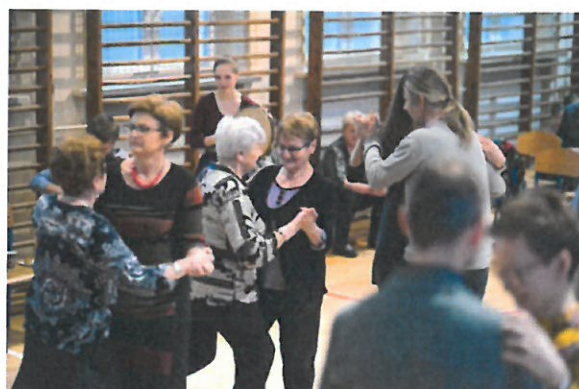
„Karnawałowy dancing”