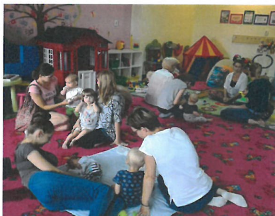
Fot. Zajęcia w ramach Bazy Rozwoju Rodziny na os. A