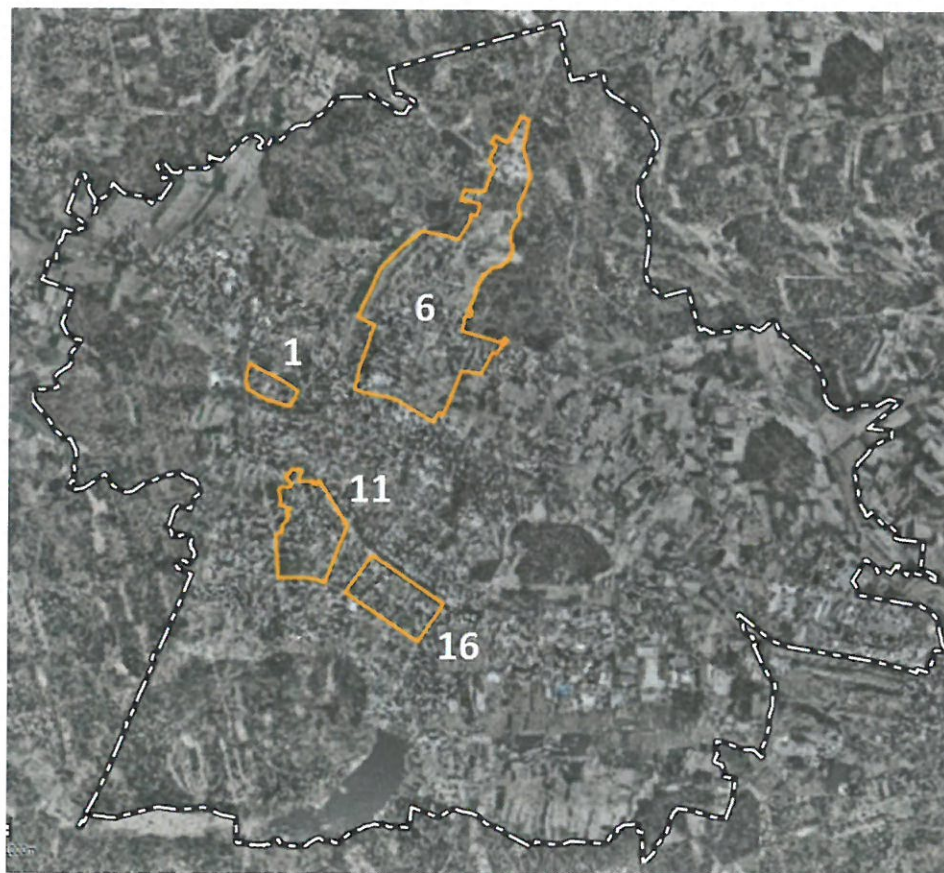
Rys. Obszary rewitalizacji miasta Tychy

W okresie sprawozdawczym nie wystąpiły przesłanki do aktualizacji Programu Rewitalizacji dla miasta Tychy do roku 2023 .