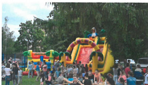
Fot. Spotkania sąsiadów przy poczęstunku, dmuchańce