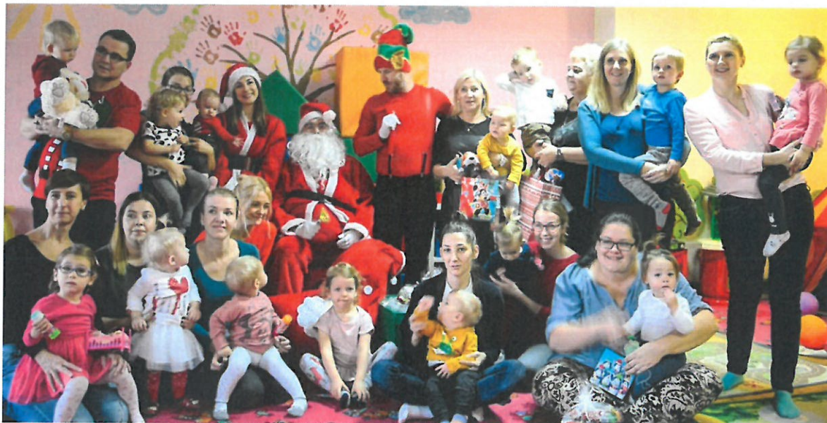
Fot. Zajęcia w ramach Bazy Rozwoju Rodziny na os. A (mat. Fundacja Multiintegra)