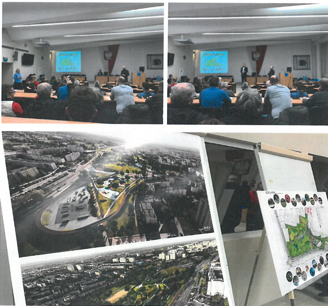
konsultacje społeczne, dotyczące Parku Jaworek w UM Tychy

W 2018 roku opracowano koncepcję zagospodarowania parku. Ponadto, 28 listopada 2018 roku w sali sesyjnej Urzędu Miasta Tychy odbyły się konsultacje społeczne.