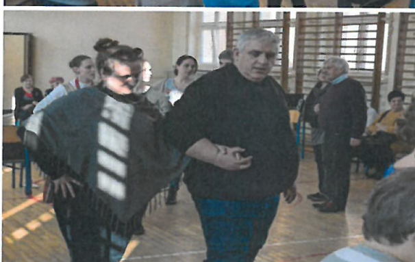
„Muzyczne przygotowania do Wielkanocy”