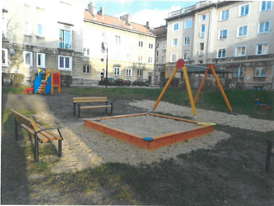
Fot. Powstałe place zabaw