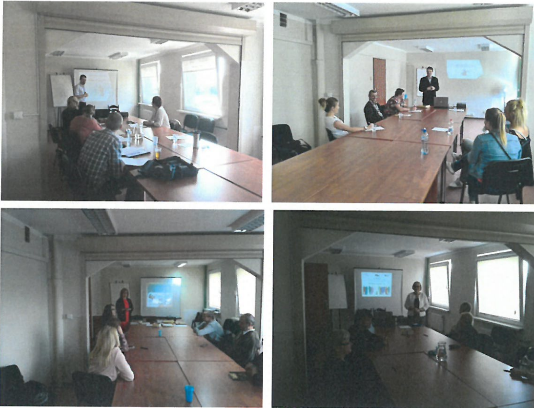
Fot. Warsztaty w ramach projektu